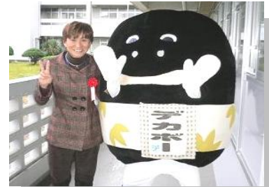
篠山のゆるきゃら デカポーと