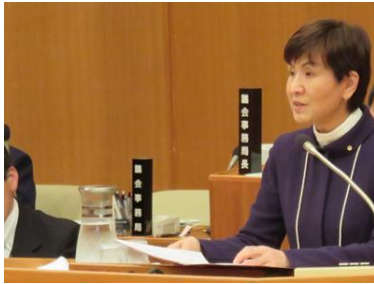
3/26 予算特別委員長報告

4月1日に宝塚市は市制60周年を迎え、2014年度は各種の周年事業が計画されています。それらのイベントが一過性のものではなく、市民に愛され発展していく活動へと繋がってほしいと願っています。私の市議会議員生活も12年目に入りました。3期目のまとめの活動となりますので、しっかりがんばります。今後とも私の活動についてのご意見をお聞かせくださいますよう、よろしくお願ひします。