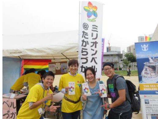
「ミリオンベール@たからづか」メンバー

大阪レインボープライドにブース出展。パレードもとても盛り上がり、沿道からも手を振っての応援があり勇気づけられました。