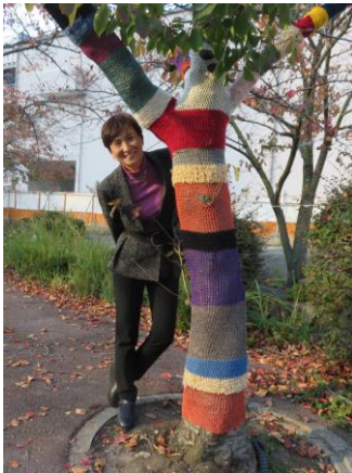
「宝塚現代美術てん・てん」