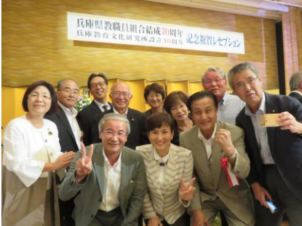
日本民主教育政治連盟メンバー